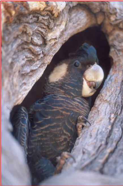
Vrouwelijk Carnaby's Kaketoe in het nest

bestaat uit bloemen, nectar en zaden van Banksia, Dryandra, Hakea, Eucalyptus, Corymbia, Grevillea, en ook zaden van Pinus, vruchten en noten bomen vooral amandelen en macadamias, en het vruchtvlees en het sap van appels en dadels en insecten larven