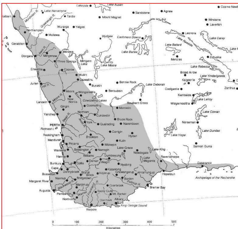
Huidige verdeling in zuid-west West Australie